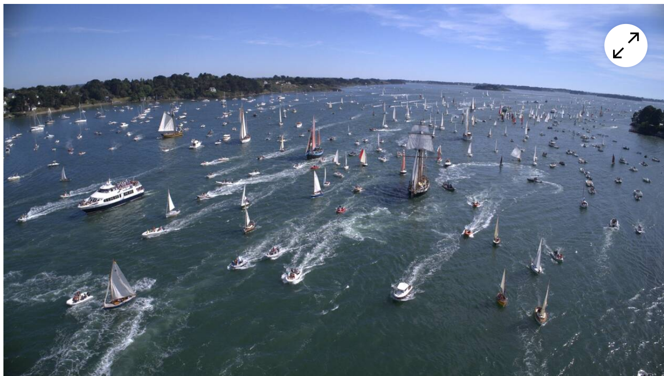
Semaine du Golfe : la parade entre Port-Blanc à Baden et l'île-aux-Moines | OUEST-FRANCE

La dixième édition de la Semaine du Golfe a connu un succès encore plus fabuleux que les neuf précédentes. De quoi motiver son équipage de 3 500 bénévoles pour faire encore mieux en 2021 !