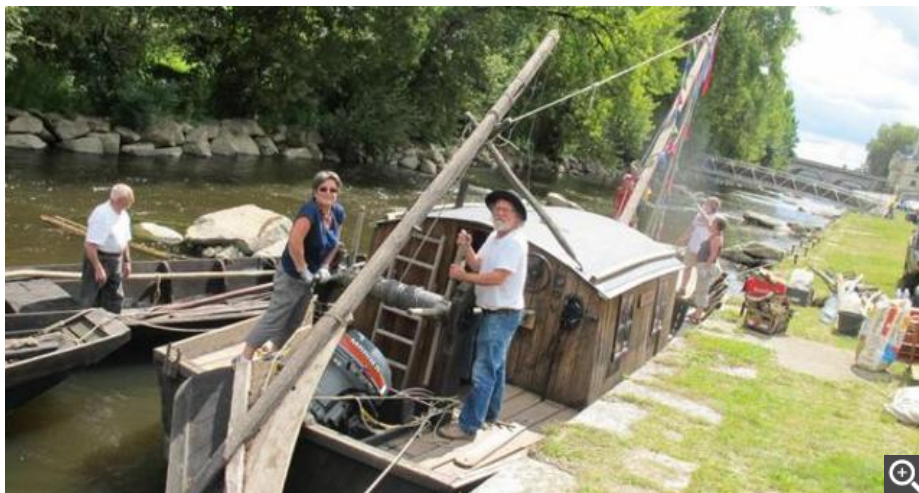
Aujourd'hui et demain, Châtellerauld renoue avec son passé portuaire, ses bateaux et son folklore.